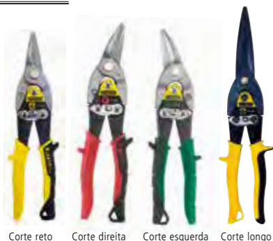
Corte reto Corte direita Corte esquerda Corte longo