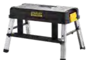
Elevador 150kg de capacidade máxima