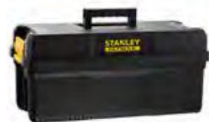
Caixa 25" IP54 e pega ergonómica