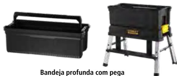
Bandeja profunda com pega Os fechos laterais seguram a caixa acima do elevador.